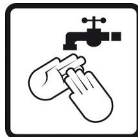
Enjuagar las manos con agua fría antes de lavarlas.