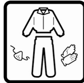
Cubrir la piel expuesta. Usar mascarilla si la zona no está ventilada.