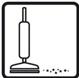
Aspirar la zona