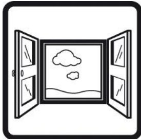
Ventilar la zona de trabajo.

“El efecto mecánico de la lana de roca en contacto con la piel puede causar irritación temporal”